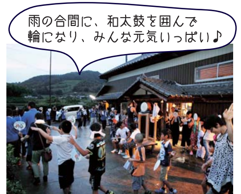
雨の合間に、和太鼓を囲んで輪になり、みんな元気いっぱい♪