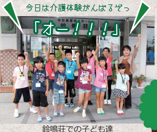
鈴鳴荘での子ども達

こども介護日 夏休みに、それぞれの施設で、「こども介護日」を実施しました。この取り組みは、こどもが保護者である職員の従事している仕事を理解し、体験することを目的としています。 こども達は、食器洗い、洗濯・掃除まで丁寧にこなしていました。また、ご利用者さんたちとパズルをしたり、歌を歌ったり、お話しもたくさんしたりして、大変貴重な一日となりました。