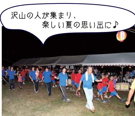
沢山の人が集まり、楽しい夏の思い出に♪