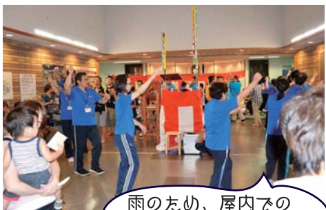
雨のため、屋内での盆踊りとなりました。