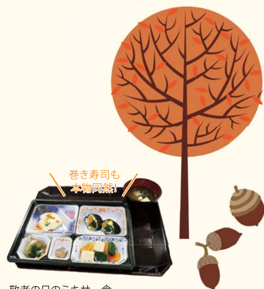
敬老の日のミキサー食 全て一つ一つの具材をミキサーにかけ、ゲル化材をまぜて呑み込みやすいやわらかさに、元の形に戻して盛り付けまでこだわってます!!