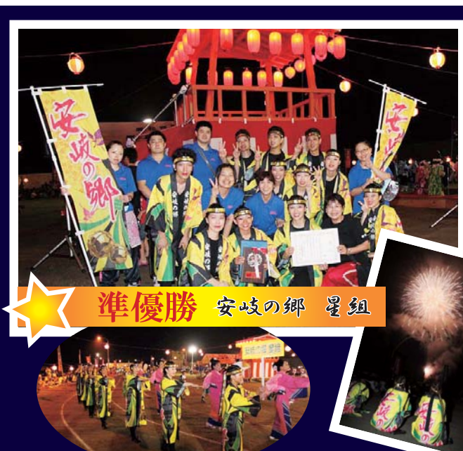
準優勝 安岐の郷 星組

第41回 夏の夜まつり (武蔵港) 今年で6回目の出場となる、懸賞踊り。結果は「準優勝」。チームの団結力では一番だったと思います。来年は優勝目指して頑張ります。