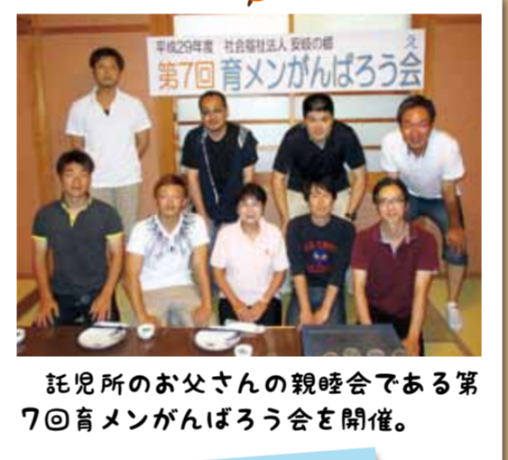
託児所のお父さんの親睦会である第7回育メンがんばろう会を開催。