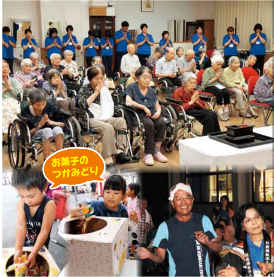
お菓子のつかみどり