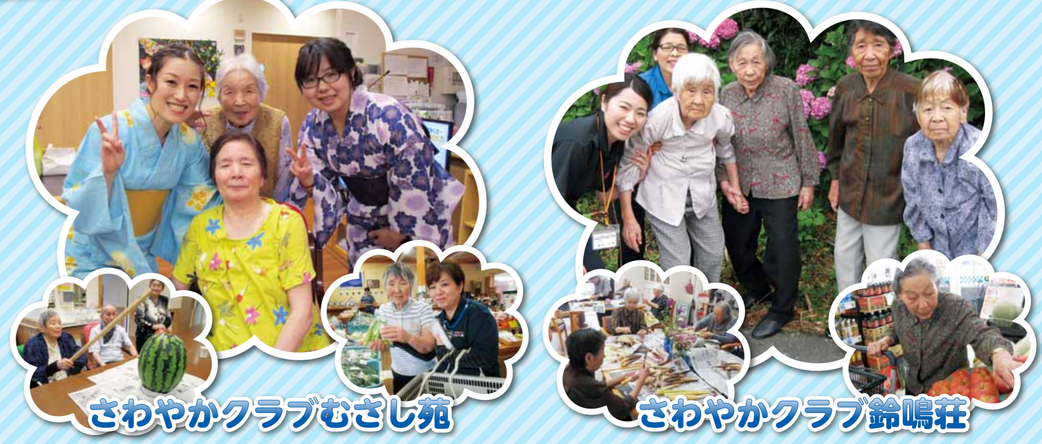
さわやかクラブむさし苑

グループホームでは、穏やかに過ぎゆく時間の中で、季節の旬を感じることができるよう「季節感」を大切にしております。ここではそのひと時をご紹介します。