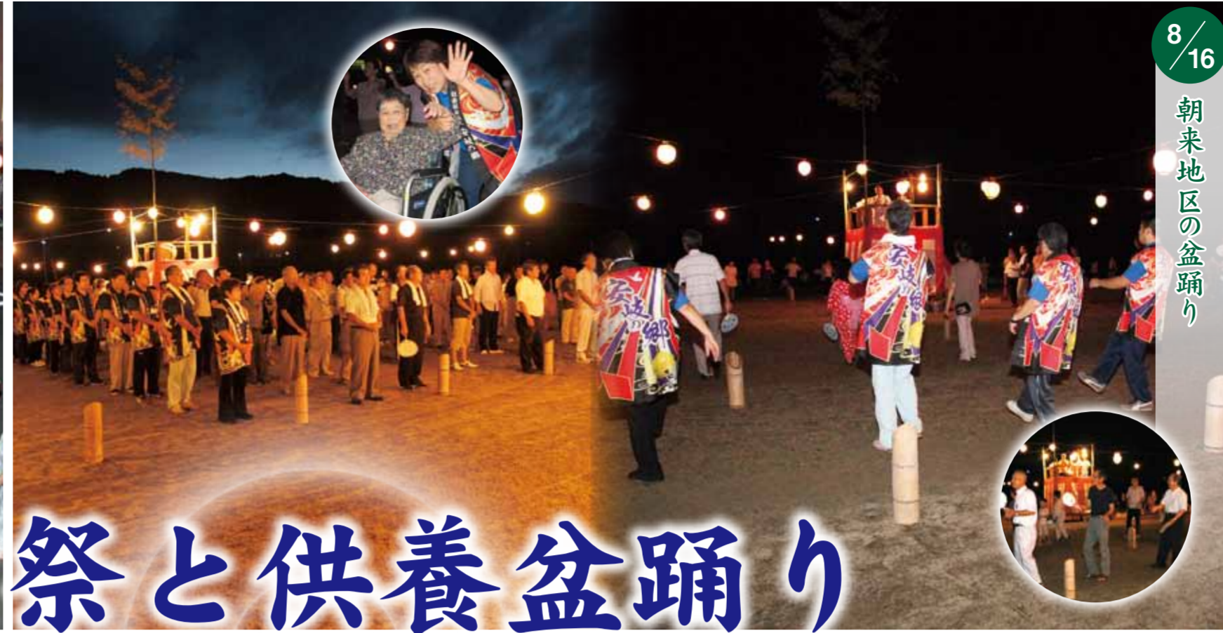
8/16 朝来地区の盆踊り