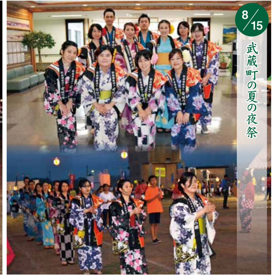
8/15 武蔵町の夏の夜祭