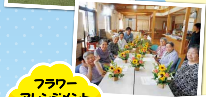
フラワーアレンジメント教室