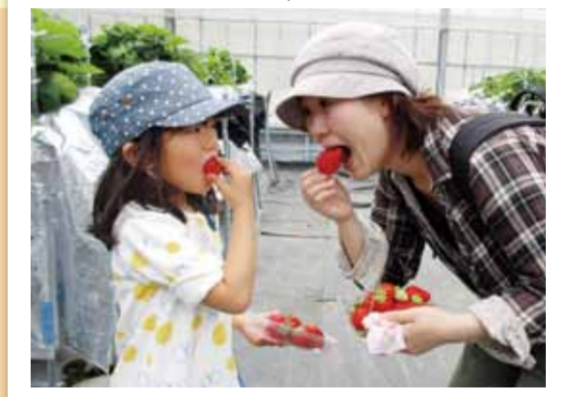
今年の託児所の親子遠足は、杵築市の住吉浜リゾートパークに行きました。海岸での遊びヒイチゴ狩りを楽しみました。