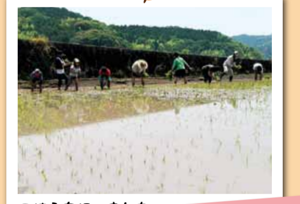
田植えを行いました。